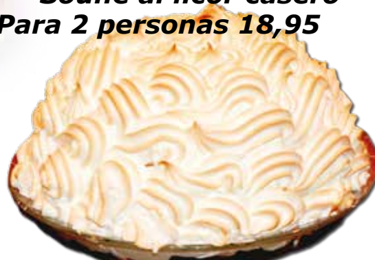
Souflé al licor casero Para 2 personas 18,95