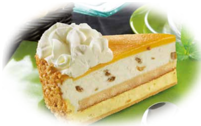
Tarta Whisky 5,50