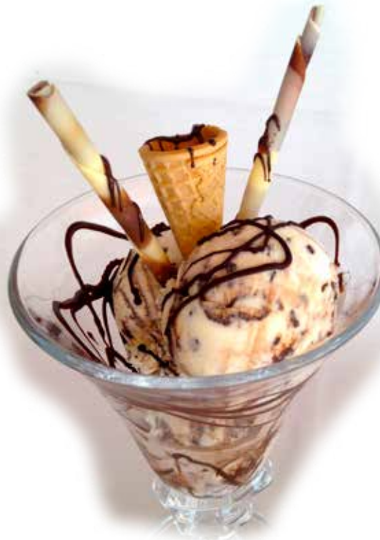
Copa Straciatella 6,95