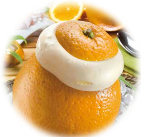
Naranja helada 5,95