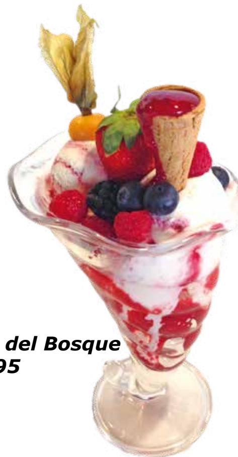
Copa Frutas del Bosque 7,95