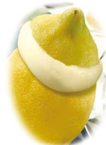
Limón helado 5,95