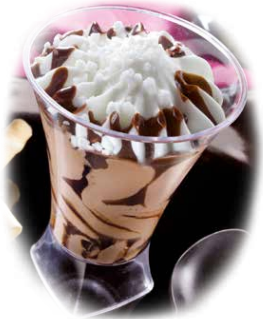
Copa Bombón 5,95