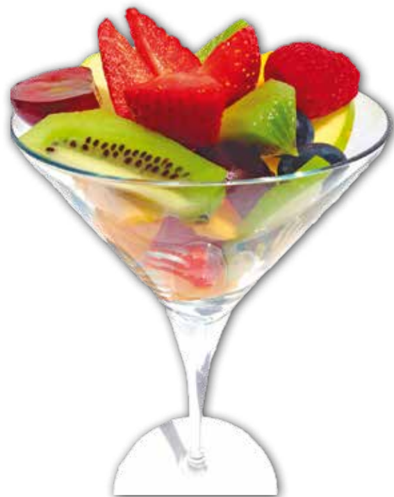
Macedonia de Frutas 7,95