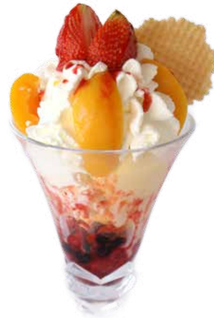
Copa Melba 7,95