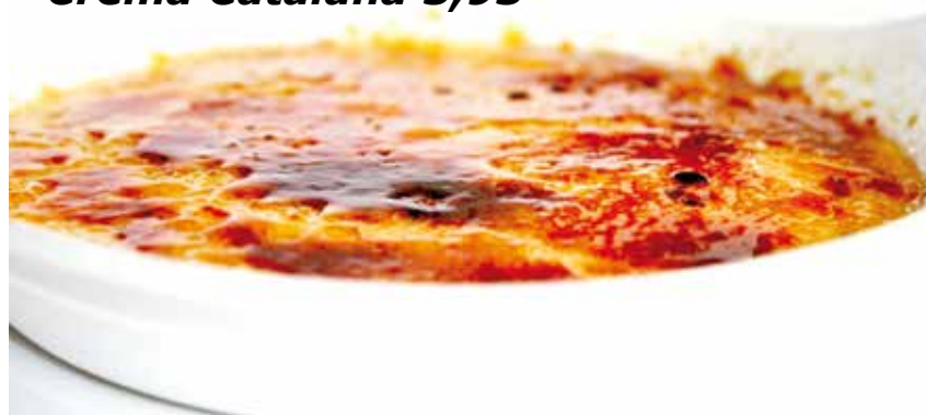
Crema Catalana 5,95