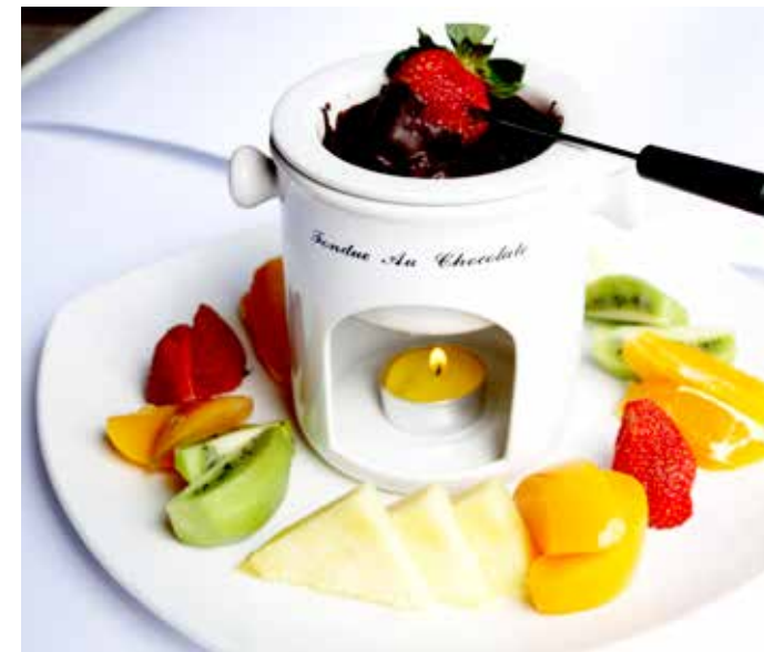
para 2 personas 18,95