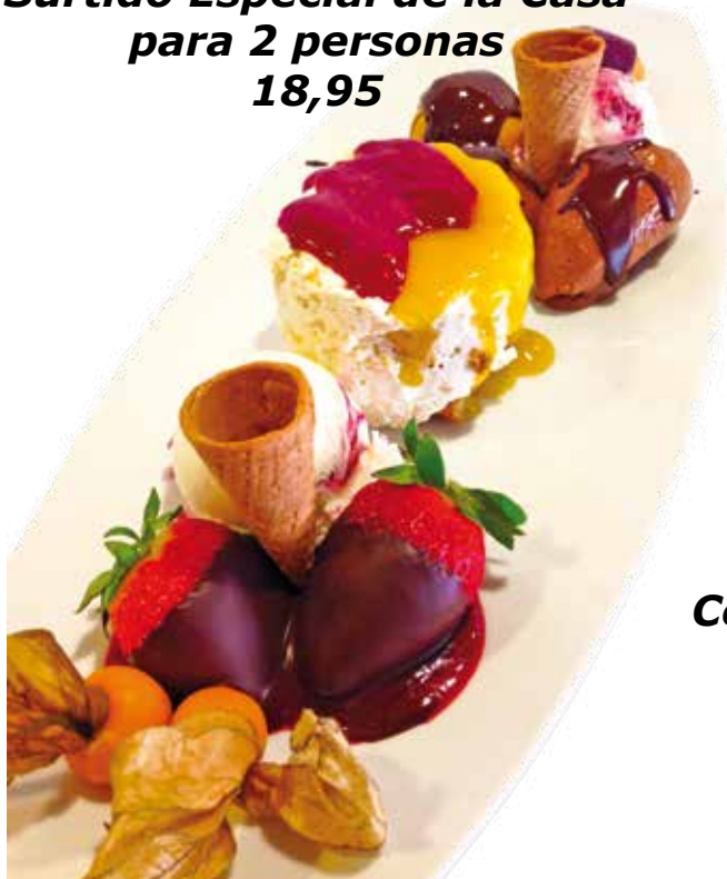
Surtido Especial de la Casa para 2 personas 18,95