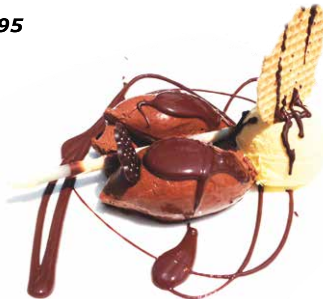
Mousse de Chocolate 7,95