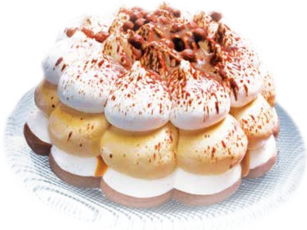
Tarta Fantástica individual 5,95