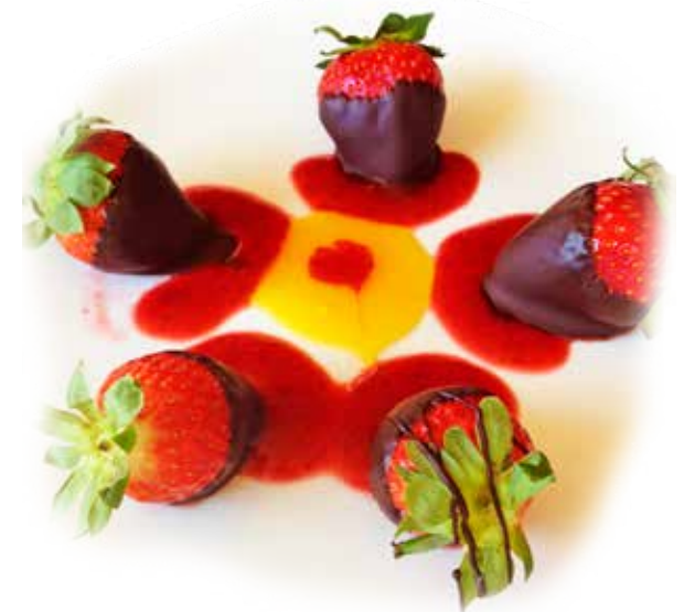
Fesas con Chocolate 1 x 1,25