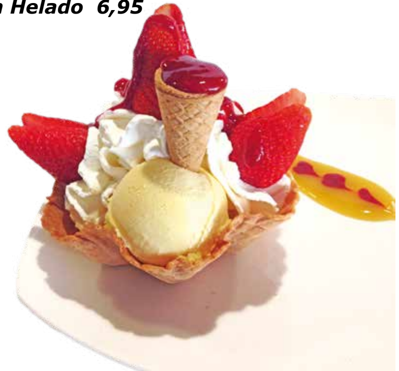
Fresas con Helado 6,95