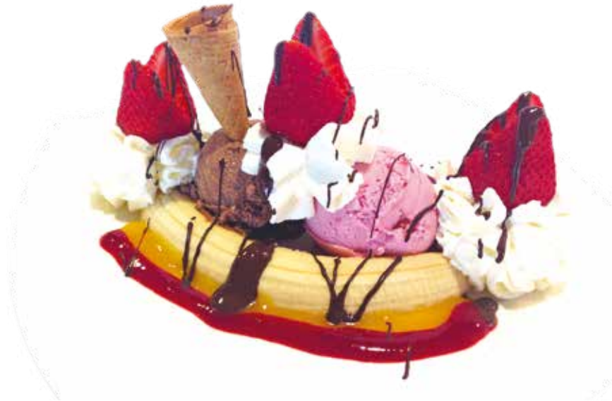
Banana Split 6,95