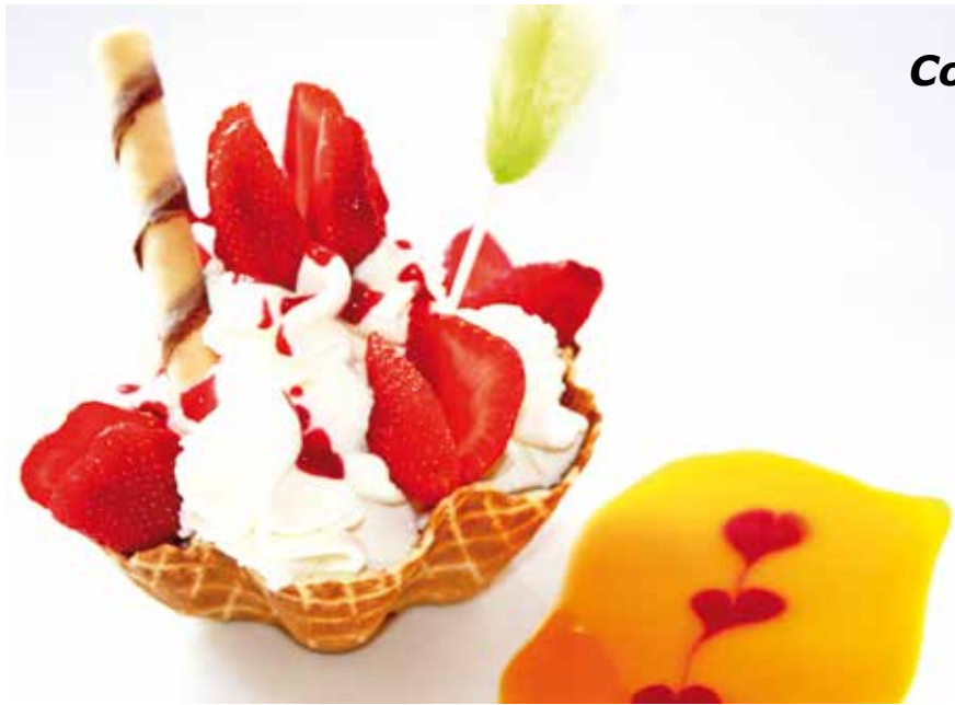
Fresas con Nata 6,95